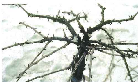
Detail ořezané šestileté korunky angreštu

Stromky angreštu vysazujeme ke kolíku nebo drátence tak, aby kůl nebo drát procházel korunkou stromku. Výhony po výsadbě seřezáváme zjara krátce na dva až tři pupeny, slabé výhony na jeden pupen. Z vyrostlých výhonů vybereme čtyři až pět nejsilnějších jako základ korunky. Ve druhém roce zkrátíme ponechané výhony