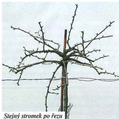
Stejný stromek po řezu