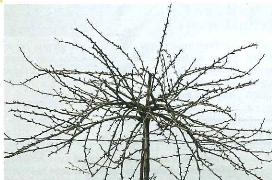
Čtyřlétý stromek angreštu odrůdy MUCURINES – před řezem